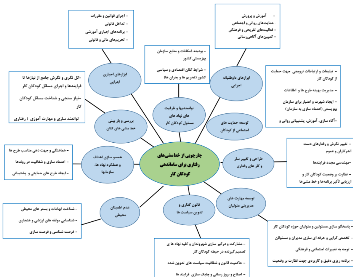
شکل ۲. چارچوب مفهومی استخراجی پژوهش