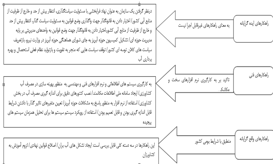
شکل شماره ۳. جریان‌شناسی یافته‌ها و راهکارهای پژوهشی استخراجی از مقالات مورد بررسی

راهکارهای مورد بررسی این مقاله را می‌توان از سه بعد راهکارهای آرمانی و ایده‌آل، راهکارهای واقع‌گرا یا راهکارهای منطبق با شرایط بومی کشور و راهکارهای فنی دسته‌بندی کرد. راهکارهای آرمانی یا ایده‌آل اولاً: به معنای راهکارهای غیرقابل اجرا نیست بلکه به معنای ارائه راهکارهایی است که در شرایط فعلی کشور اساساً توسط سطوح مدیران ارشد قابل پیگیری نمی‌باشد و در شرایط حاضر نمی‌تواند به عنوان راه حل فوری و قطعی عملیاتی شود و نیازمند گذر زمان می‌باشد. ثانیاً: در میان پیشنهادات یک نویسنده همه راهکارها نمی‌تواند ایده‌آل (آرمانی)، واقع‌گرایانه یا فنی باشد بلکه می‌تواند ترکیبی از این راه‌ها به عنوان راه‌های پیشنهادی از دیدگاه نگارنده مقاله یا پایان نامه ارائه شود. راهکارهای ایده‌آل‌گرایانه بر سیاست‌هایی چون در نظر گرفتن یک سازمان به عنوان نهاد فرابخشی با مسئولیت سیاست‌گذاری، انتظار بیش از حد و خارج از ظرفیت منابع آبی کشور، اختیار دادن به قانون‌گذار جهت واگذاری وضع قوانین به واحدهای مدیریتی بر پایه مدیریت حوزه‌ای، تشکیل کمیسیون حوضه آبریز به جای شورای هماهنگی حوزه آبریز در وزارت نیرو، بازتعریف سیاست‌های کلان توسعه‌ای کشور، توقف سیاست‌هایی که بر تقویت و بازتولید نظام فعلی استحصال و بهره‌برداری آب تأکید می‌کنند. به هر حال در مجموع ۲۳ درصد از مقالات چنین راهکارهایی را