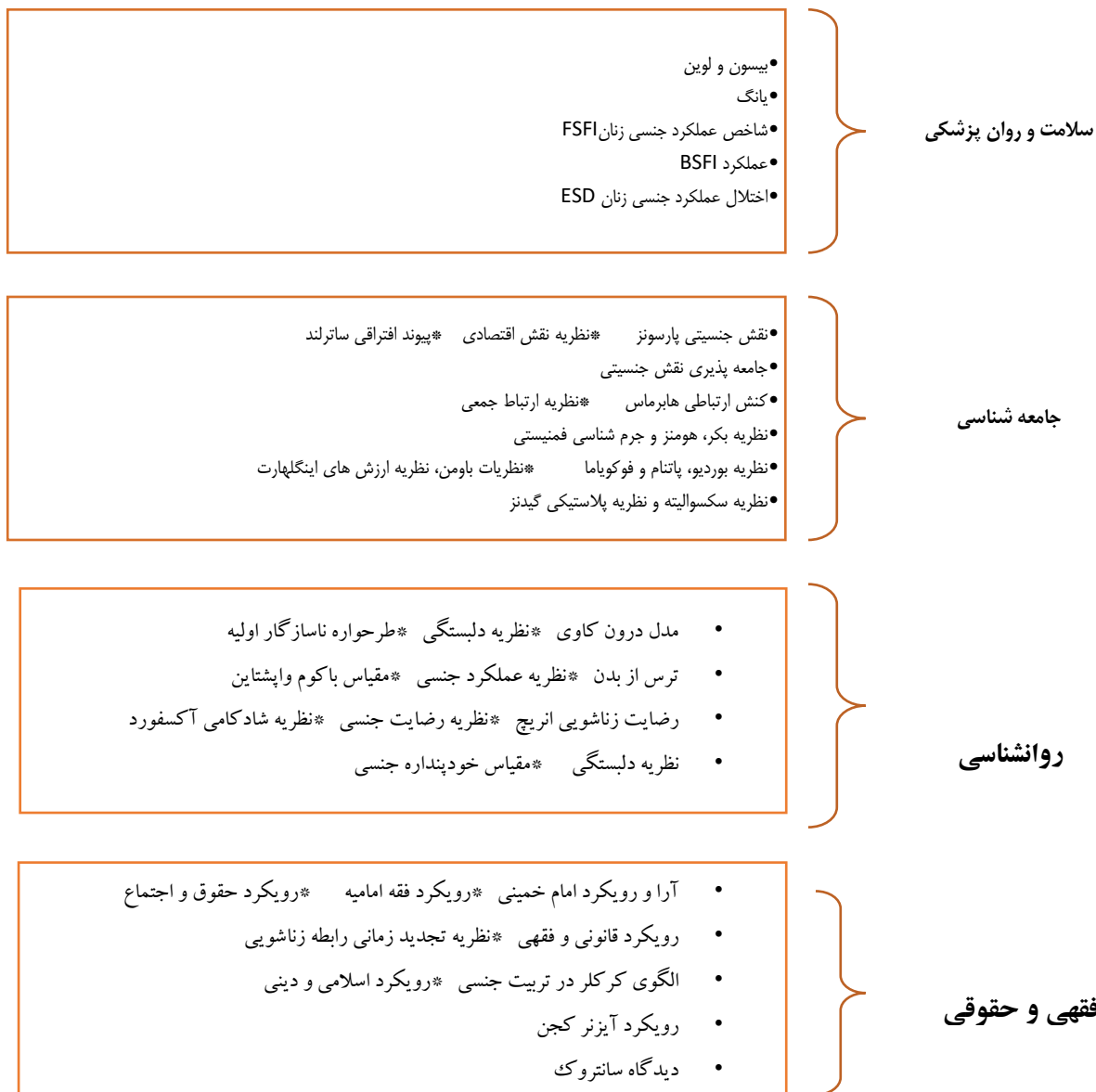
شکل ۱- رویکردهای نظری تحقیقات